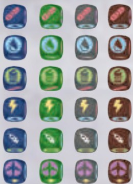
24 dobbelstenen (6 stuks in 4 kleuren)