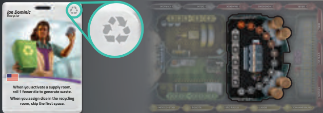
Recycler Ian Dominic begint in de recyclingruimte.

Iedere speler heeft een karakter tijdens het spel. Rechtsboven op de karakterkaart staat aangegeven waar dit karakter op het bord begint (dit wordt gebruikt tijdens de voorbereiding). Je karakter heeft speciale eigenschappen die je tijdens het spel kunt gebruiken.