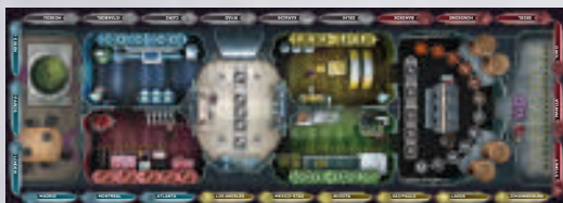
1 spelbord met de binnenzijde van een vliegtuig