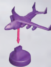
1 vliegtuig op een standaard