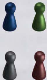
4 pionnen (1 per kleur)