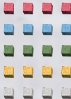
20 voorraadkratten (4 stuks in 5 kleuren)